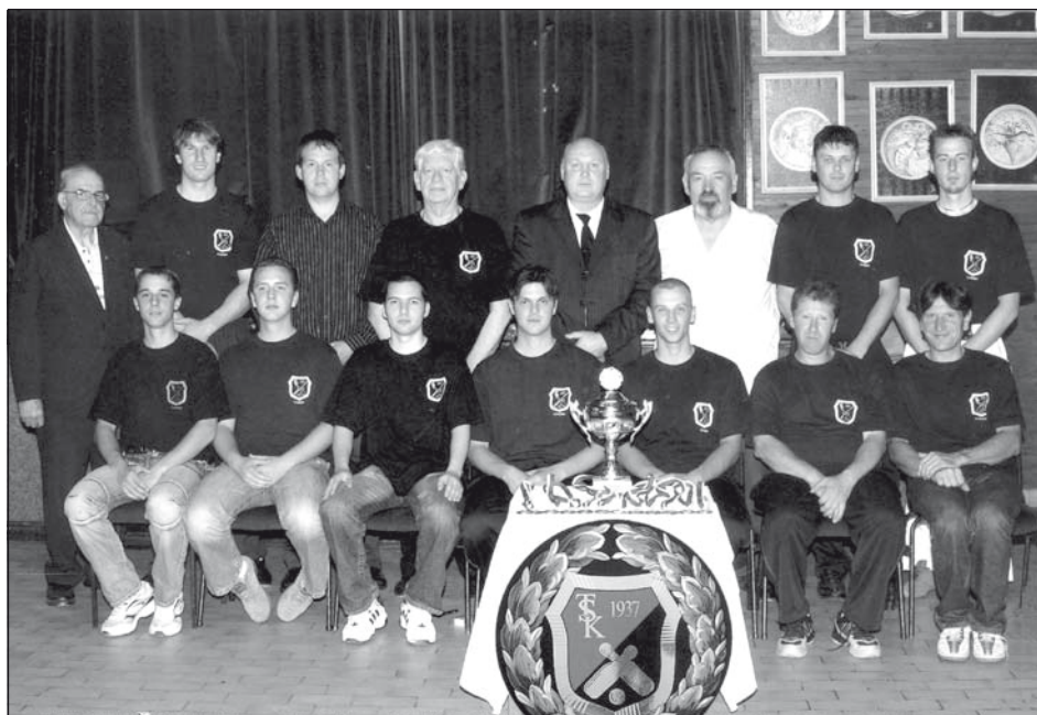
A TSK tekecsapata 2007-ben

– A temerini pálya annyira hasznavehetetlen, hogy rekreatív