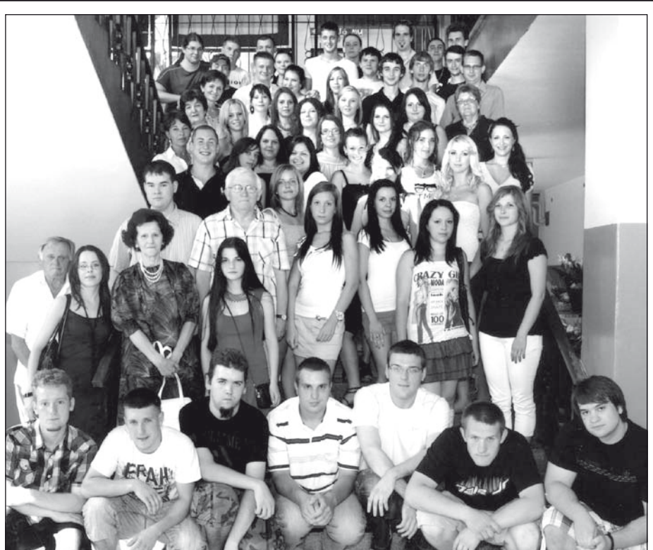
Ötéves osztálytalálkozót tartottak a 2007-ben végzett 8. a, b, c és d osztály tanulói. Az osztályfőnöki órát a Kókai iskolában, míg az esti mulatságot a Rubin étteremben tartották. A találkozón mintegy ötven iskolatárs jelent meg.