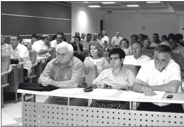
Az új/régi képviselők az alagsori ülésteremben

ciók betöltésére, ám a kézfelemeléssel történő szavazásokból már körvonalazódott, hogy mely pártok jöhetnek számításba a községet irányító és a községi tanácsot képező koalíció megalakításában, és kik lesznek azok, akik az elkövetkező négyéves