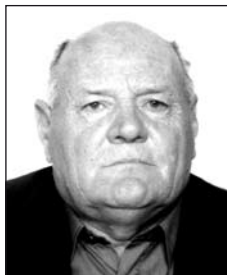
PÁLKÁS Mihálytól (1928–2012)