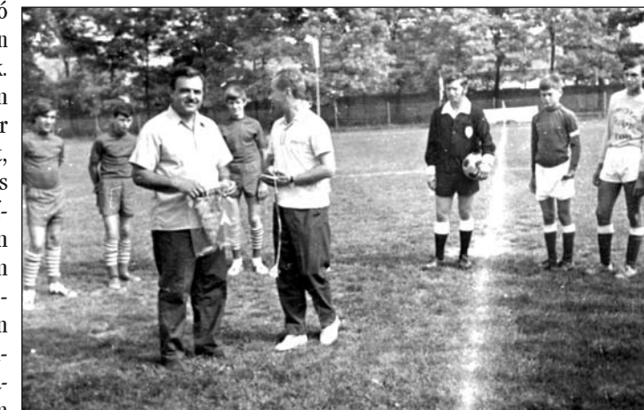
A tanító bácsi szívügye a fiatal labdarúgók nevelése