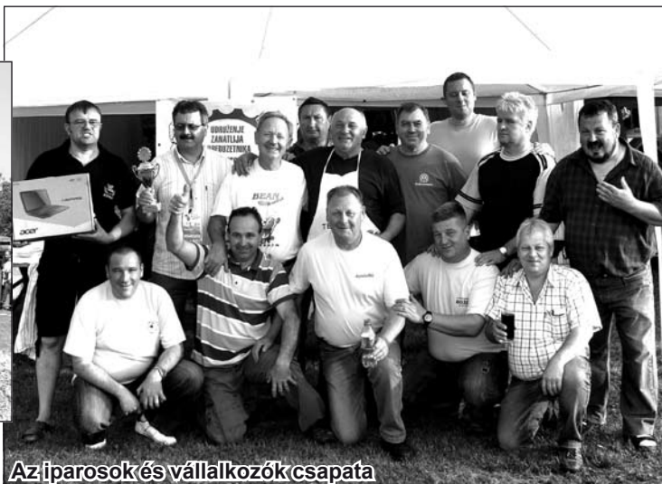
Az iparosok és vállalkozók csapata

Második helyre a temerini Bucin szállás csapata került, serleget, oklevelet és motokultivatort nyertek, amelyet a Delta Agrar cég ajándékozott.