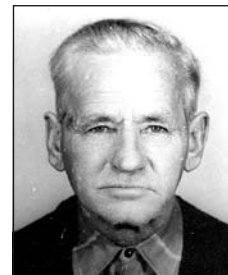
FARAGÓ András (1912–1987) 25 éve halott

Nehéz elviselni a szomorú valóságot, hogy nincsenek többé közöttünk, akiket nagyon szerettünk