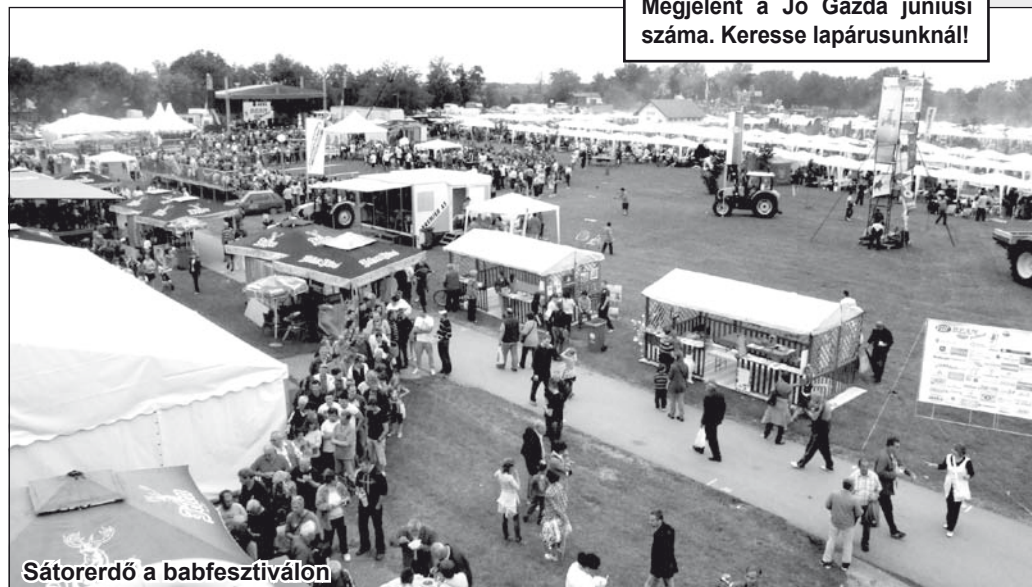
Sátorerdő a babfesztiválon

TEADÉLUTÁN – Az újdé-ki Petőfi Sándor MMK június 10-én (vasárnap) Teadélután szervez, 17 órai kezdettel, a művelődési ház nagytermében. A jó zenét a Dutty zenekar szolgáltatja, belépődíj 250 dinár. Mindenkit szeretettel várnak a szervezők.