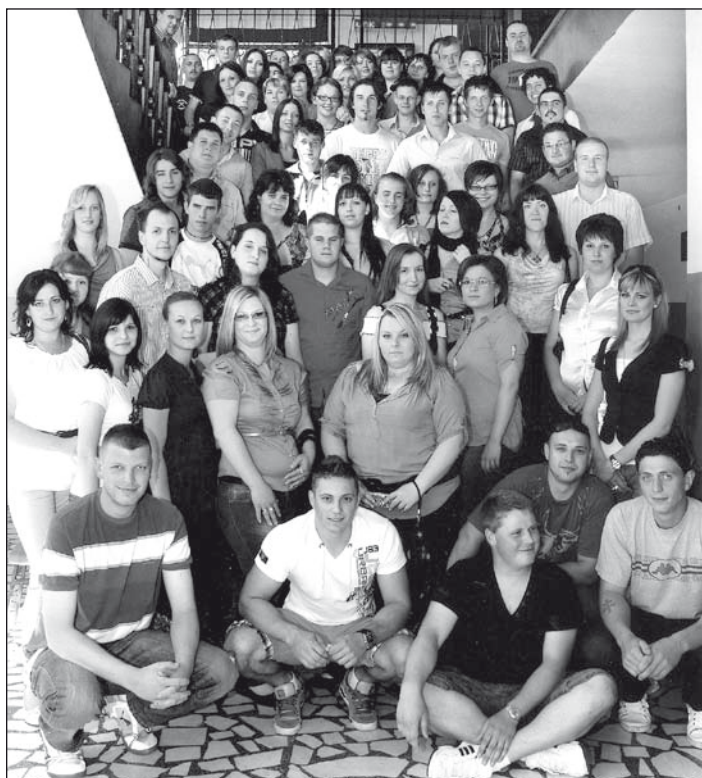
A Kókai Imre és a Petar Kocsics Általános Iskola 2001/2002-ben végzett növendékeinek tízeves osztálytalálkozóját tartották a hétvégén

Temerin, Bem u. 22., tel.: 842-530, 064/234-38-53