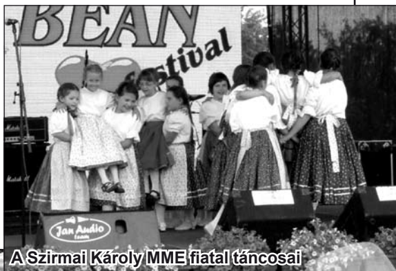
A Szirmai Károly MME fiatal táncosai

A babfőzősök dobogójának legmagasabb fokára, az első helyre a belgrádi Dzsandari nevű csapat került. Jutalmuk serleg, diploma és egy robogó (szkúter), a Sky motors ajándéka.