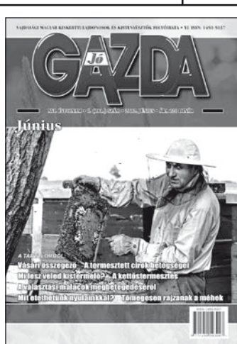
Mégjelent a Jó Gazda június 7. száma. Keresse lapárusunknál!