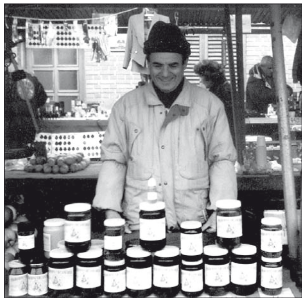
Az újdéki Halpiacon, ahol kolbászt, majd mézet árult négy évig

– Igen, ötvenkétszeres véradó vagyok. Mióta gyógyszereket szedek, azóta nem adok vért, nem tanácsos már ilyenkor. Azon kívül, amikor a Diáksegélyező Egyesület megkezdte munkáját, abba is bekapcsolódtunk és segítettünk, ahol tudtunk. Visszaemlékezem még arra, amikor nehéz helyzetben voltam és nekem is segítettek,