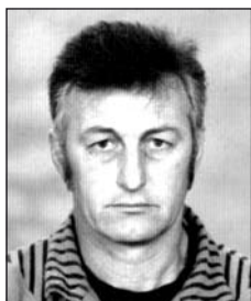
FINNA Lászlótól (1950–2012)

Csillagok közt él már, angyalok közt jár, ott, ahol csendből épül vár, s lelkére Isten vigyáz már.