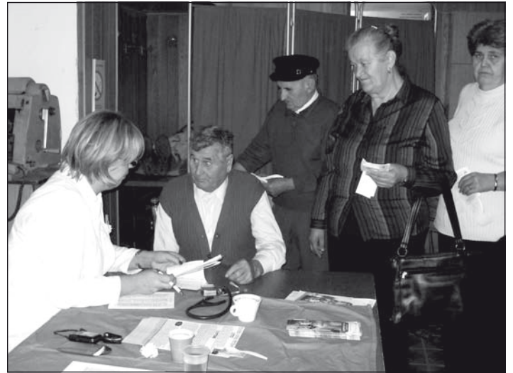
Az eredmények ismeretében a szakorvos tanáccsal látta el a polgárokat

Múlt szombaton délelőtt a cukorbetegség elleni harc világnapja alkalmából egészségügyi bazárt tartottak a község háza alsorsori halljában. Ennek keretében az egyik újvidéki magánegészség ház orvosai és nővérei ingyenes vérnyomás-, vércukorszint-, testsúly- és testmagasság stb. vizsgálatot/mérést tartottak és tanáccsal látták el azokat, akiket megvizsgáltak.