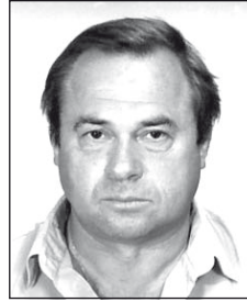
NÁSZ Istvántól (1949–2011)

Oly hirtelen jött a szörnyű pillanat, eltűnt egy élet, csak a sírhalom maradt.