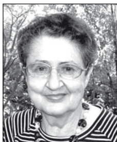
MATUSKA Magdolnától (1931–2011)