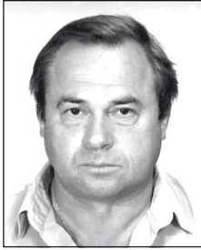
NÁSZ Istvántól (1949–2011)

Egy szál gyertya, mely végigég. Egy élet, mely gyorsan véget ért. A temető csendje ad neked nyugalmat, emléked osztálytársaid szívében örökre megmarad.