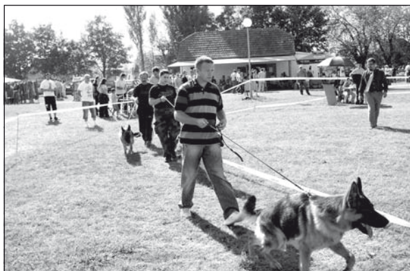
Futtatás a ringben

versenyzők. Nemzetközi zsűri értékelt a fel-sorakoztatott kutyákat, figyelembe véve az állatok küllemét, tartását, viselkedését, fogazatát, kondícióját stb.