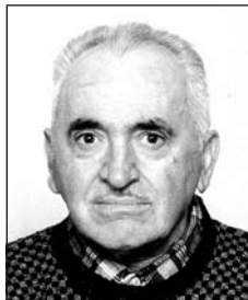
VECSERA János (1927–2009)

Ők ketten hiányoznak közülünk, elmentek, csendben távoztak. Nem búcsúztak, de emléküik örökre a szívünkbe megmarad.