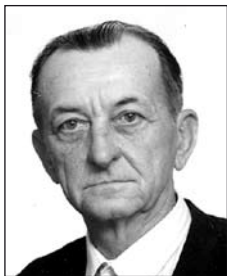
CSESE András (1928–2006)

Szomorú öt éve, hogy szeretteid nélkülöd élnek