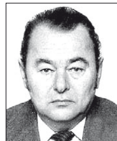
id. BUJDOSÓ Illés (1947–2009)

Szomorú két éve, hogy nincs közöttünk, akit szeretettünk