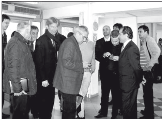
Megérkeztek az olasz üzletemberek