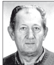
FEHÉR Mihálytól (1934–2011)