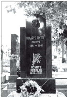
A költő sírja a temerini nyugati temetőben

és jelentette meg a Bács megye c. lapban. A trianoni békediktátum után sem hagyta el szülőföldjét, tanítókodása mellett rendszeresen írt a Temerini Újságnak és az újvidéki Délbácskának, de ha kellett, kocsmai, lakodalmi zenekarokban tamburált, csak hogy eltarthassa népes családját.