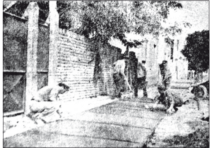
Korabeli újságfotó: Végig betonjárda lesz a főutcán. Az őszi esőzések beálltáig elkészül.

lattal élve – lakossági fórumokon lehetett tájékozódni a helyi eseményekről, tervekről és hozzászólás formájában véleményt is lehetett mondani. Így kiderült, hogy az 1967. évi községi költségvetésben nem sok pénz maradt a kommunális tevékenységek végzésére. Igaz, eddig is minimális összeg jutott, rendszerint csak a földművesek adójának két százaléka. A