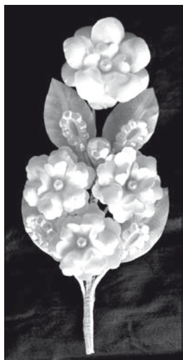
Mirtusz: vőlegények, elsőáldozók viselik

A keményre száradt anyagot később a kívánt mintaformával ki kell verni. Amikor ezzel elkészülök, a szírmokat rárakom az alátétre, egy kis homokzsákra, és árral kiszúrom a közepét. Ezen a lyukon keresztül kell majd felfűzni a drótra. A különböző nagyságú virágokat a megfelelő nagyságú vasalóval vasalom. Ez úgy történik, hogy lámpa fölött fölmelegített vassal egyenként kidomborítom a szíromleveleket. A kész virá-