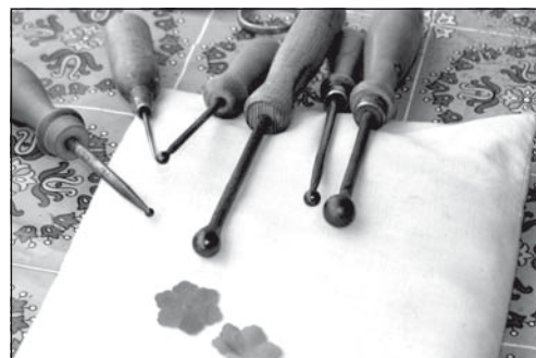
Vasalóeszközök a szírmok domborításához

gokat felfűzöm a drótra, amelyet már előzőleg előkészítettem. A drót egyik végét behajlítom, bekenem zselatinnal, majd fehér vagy festett grízbe mártom. Ez lesz majd a virág porzója. Ha azonban a megrendelő úgy kívánja, akkor gyöngyből készítem. A drótra egy vagy három sor szíromlevél kerül, a virág nagyságától függően. Végül a drótot be kell sodorni krepppapírral, az tartja a szíromleveleket. Ha rozsmaringra kerülnek a virágok, akkor ezzel kész is a munka, de én készítek koszorúkat, kítűzőt is. Ezeknél össze kell válogatni a virágokat, tüllel, gyöngyökkel kombinálni. Sok türelmet igénylő foglalkozás ez, kézművesség, amivel már kevesen foglalkoznak. Én szeretem.