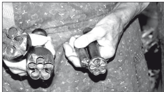
Kiverő- vagy stancolóvasak