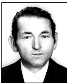
OROSZ József (1929–1995)