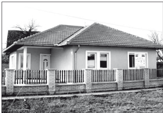
Üresen álló idősek otthona az Újsoron

Az idősek otthonaként szolgáló házak építése Temerinben öt évvel ezelőtt kezdődött az ESViT projektum keretében. A szlovák kormány, az Adra nevű szervezet, a Köztársasági Munkaügyi és Népjóléti Minisztérium, az önkormányzat és a szociális központ fogott össze az ügyben. Három évvel ezelőtt a község négy pontján öt léte-