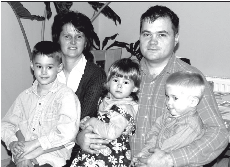
Együtt a család