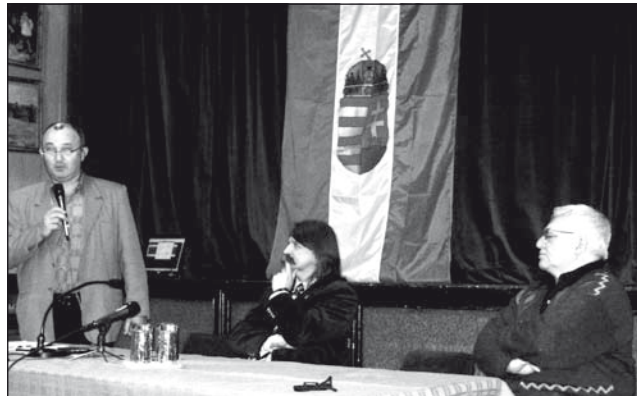
A lakossági fórum vendégei (balról jobbra): Ternovác István, Kövér László, és Csorba Béla

– Ahogy 2002 előtt nem a Fideszen múlt, hogy jó viszonyt tudott-e kialakítani a szomszédos országok politikai vezetésével, hanem azoknak a vezetéseknél a belátásán, jóakarátán, szándékain, ugyanígy ez a jövőre vonatkozóan is igaz, és igaz Szerbia vonatkozásában is. Magyarországnak akkor a gazdasági növekedéséből meg az erősödő lelkiállapotából fakadóan, tekintélye volt, amit a szocialistáknak sikerült az elmúlt 8 évben lerombolni. Szerbia azért mégis abban a speciális helyzetben van a