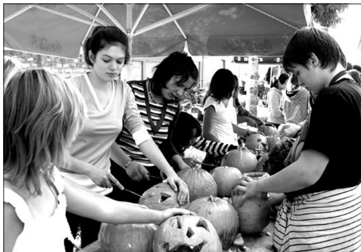
Készülnek a töklámpások

tő, amíg a mag ki nem kel. Aztán csakis kézi munkaerő jöhet számításba. Nem tudnám megmondani, hogy hány kilométert gyalogoltunk összesen az egy holdon sarlóval, kaszával, kis permetezővel. Évente egy holdon termesztünk Oliva fajta kabaktököt. A fajtát kifejezetten magja végett nemesítették. Jellegzetessége, hogy a húsa igen vékony, sérülékeny és gyorsan romlik. Ezért a szüretelése során nagyon óvatosan kell vele bánni. A szüret egytől két hónapig is elhúzódhat. Amint a beért termést leszedtük, kibelevjük a kabakokat, és azonnal megindul a mag feldolgozása. A magok egy kis részét azonnal sütjük, és piacra bocsátjuk, egy részét a mélyhűtőben nyersen tároljuk, a többit pedig szárítjuk. Temerinben a sült tökmag a kedvelt csemege, nagyanyáink receptje szerint készülni, általában kemencében sütjük. Azonban szárított állapotban sokkal ismertebb, elterjedtebb és nagyobb is a kereslet iránta. Ennek az elkészítése abból áll, hogy a