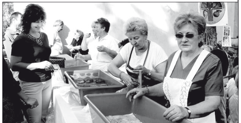
Görhéből körülbelül kétezret sütöttek, rétesből pedig ezret

Pénteken színes, tarka-barka menet vonult végig az utcákon. Gyermekkarnevált szerveztek a legkisebbeknek. A felvonulás a Kókai Imre iskolából indult, útközben csatlakoztak a menethez az óvodások, a Petar Kocsics iskola, valamint a Járekról és Szőregről érkező diákok. A végcél a piactéren felállított emelvény volt, ahol a maszkos és kifestett gyereksereg megtekintette az alkalmi szórakoztató műsort. A szervezők az elmúlt héten számos rendezvénnyel kedveskedtek a legkisebbeknek: voltak kiállítások, előadások, kreatív programok. Pénteken az elsősöket felvették a Gyermekszövetségbe, a felsősök pedig diszkóval zárták a gyermekhetet.