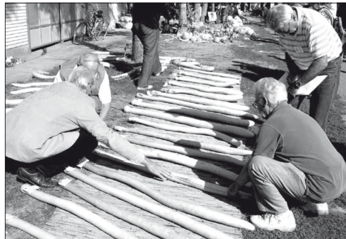
Mérik a kolbásztököket