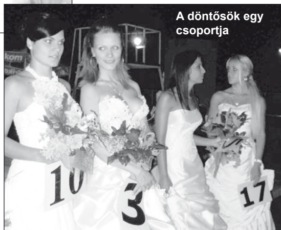
A döntősök egy csoportja