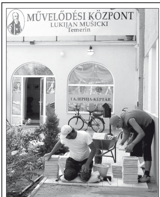
A művelődési központ előtt is sor került a járda korszerűsítésére

– Iskolánkban a már említett kalendárium értelmében a tanítás szeptember 1-jén, kedden kezdődik és december 23-áig tart. Az első félévben lesz egy rövid őszi szünetünk: október 30-tól november 2-áig. Az első munkaszombat szeptember 5-én lesz, a másodikat később határozzuk meg. A téli szünetidő december 24-én kezdődik és január 13-áig tart. (3. oldal)