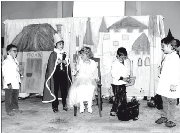
Jelenet az Aranyszőrű bárány című előadásból

nő csoportja képviselte óvodánkat. Nyolc más intézménnyel együtt mi is megívást kaptunk a csupán másodsorra megrendezendő Vajdasági