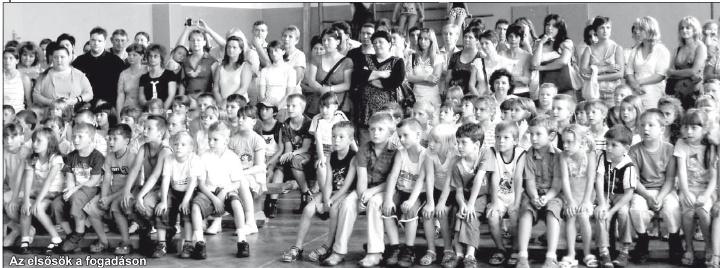
Az elsősök a fogadáson