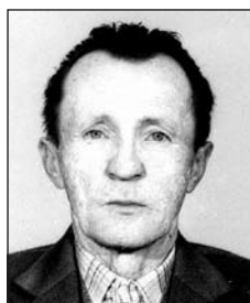
BUJDOSÓ Antal (1929–1987)