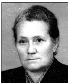
SÖRÖS Katalin (1914–1991)