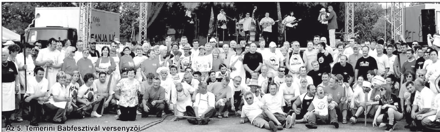
Az 5. Temerini Babfesztivál versenyzői

A csaknem három órára kerekedett bevezető után a hatalmi koalíció többségben levő képviselői 18 igen szavazattal elfogadták a testület elnöke által eredetileg beterjesztett napirendet, amelyben 8 témakör megvitatása szerepelt. A reggel 9 órakor megnyitott ülés délután fél kettőkor kezdte meg az érdemi munkát, és az még a délutáni órákban, lapunk zárása idején is tartott.