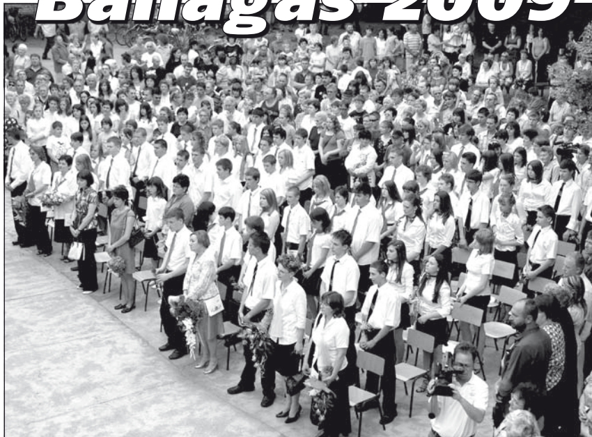
Vasárnap délután tartották a Kókai Imre iskolában a nyolcadikosok ballagását. Beszámolónk a 6. oldalon.