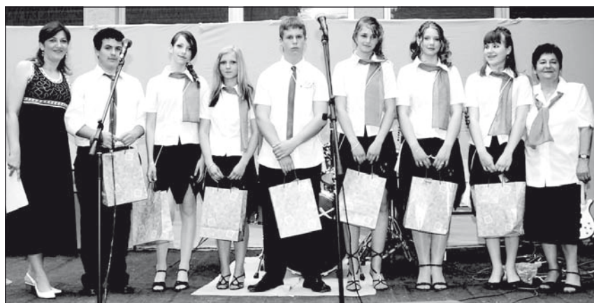
A Petar Kocsics iskola 8. d osztályának legjobbjai

Fantasztikus kereseti lehetőség! Stabil nemzetközi cég! Megtanítom, segítem, támogatom!