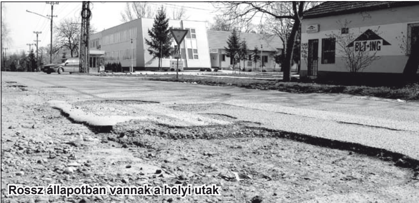
Rossz állapotban vannak a helyi utak