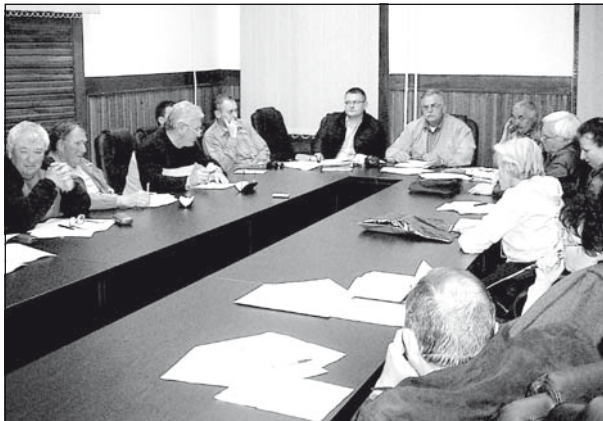
Ülésezik az Első Helyi Közösség tanácsa

ban meghozott és az utcaszakaszokat fontossági sorrendben tartalmazó terv szerint. Az illetékes bizottság az idén is terepszemből tart, és megállapítja, hogy mely szakasz javítása nem halasztható, akkor azt is beiktatják a programba. Azt tervezik,