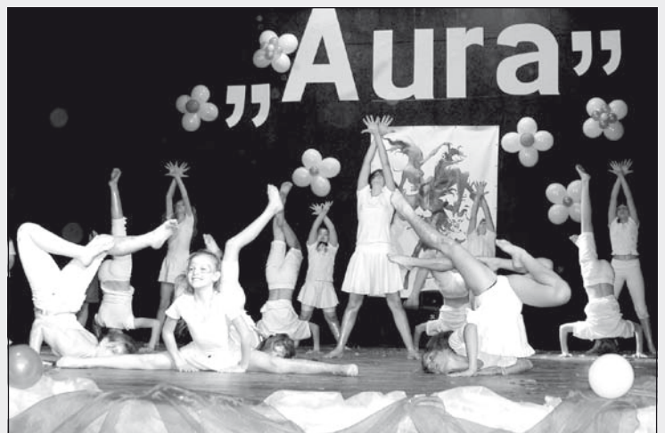
A temerini egyik koreográfiája

Az 5–8 évesek csoportja két éve foglalkozik show dance-táncokkal eredményesen. Ők a mini kategóriában versenyeznek. Az adai