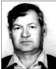
KURILLA Sándor (1942–1999)