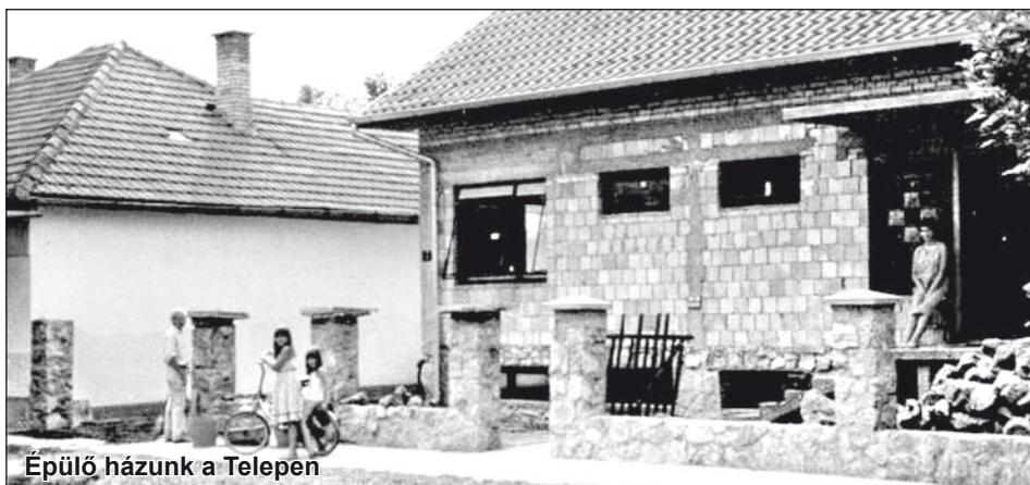
Épülő házuk a Telepen

EZZEL EGYIDEJŰLEG MUNKAHELYEMEN, a oktatóközpontban teljes emberként igyekeztem helytállni. Talán nem hangzik hősködének vagy öndicséretnek, de gondolom, hogy munkahelyemen sokan ismertek és szerettek, mert a rám bízott feladatokat emberileg és szakmailag mindenkor tisztességesen elvégeztem, ha kellett, még ebédidőben is rendelkezésre álltam. Ehhez még egy kis móka, hülyéskedés is társult.