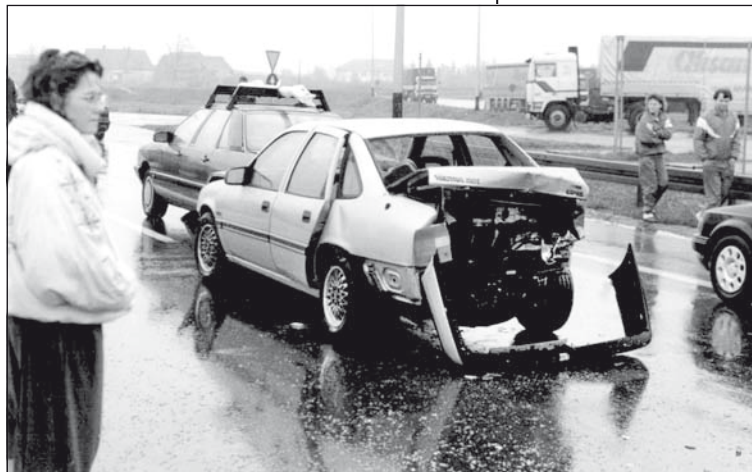
A baleset helyszíne