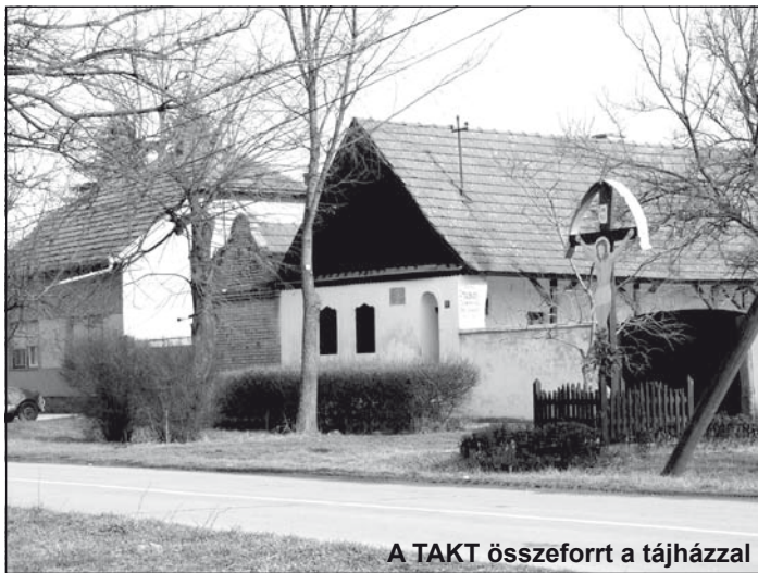
A TAKT összeforrt a tájházzal

nyári – július 27-én kezdődő – TAKT-tábor szervezésére kérünk támogatást. Július elején, a mórabalmi faluünnep keretében történne a tavalyi TAKT-táborban készült alkotások kiál-