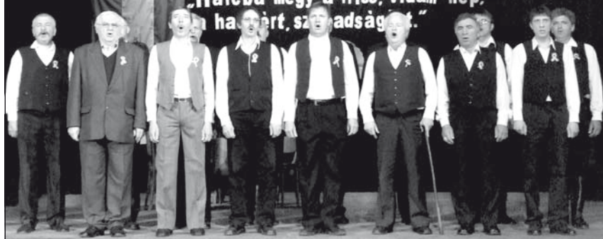
A férfikórus a Himnuszt éneкли

„Harcba megy a friss, vidám nép, a harcot, szabadságot.”