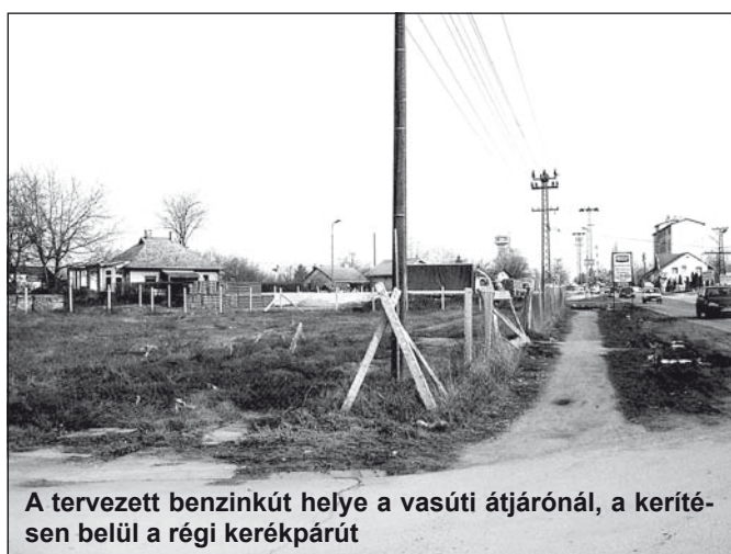
A tervezett benzinkút helye a vasúti átjárónál, a kerítésen belül a régi kerékpárút

– A jelenlegi, érvényes községi tervek szerint a telek tulajdonosának, aki benzinkutat akar építeni, vissza kell adnia mintegy 8 méter széles sávot a községnek, hogy ott elhaladhasson a szenny-csatorna Kolónia és Járek irányába. A tulajdonos ezt a tervet megfellebbezte a különböző felügyelőségeken, és a bíróságokon is. Várom, hogy a jogállam intézményei elvégezzék a munkájukat, s ha ez megtörténik, akkor majd továbblépjünk.