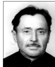
MORVAI András (1914–1990)

Minden szál virág, amit a sírokra teszünk, elmondja, mennyire hiányoztok nekünk. A halál nem jelent feledést és véget, míg élnek azok, akik szeretnek titeket. Oly messzire mentetek, út vissza nem vezet, imáinkba foglaljuk, az Úr legyen veletek. Légy irgalmas hozzájuk mennyek ura, könyörögj érettük Istennek szent anyja!