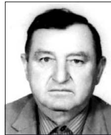
VARGA István (1913–1996)