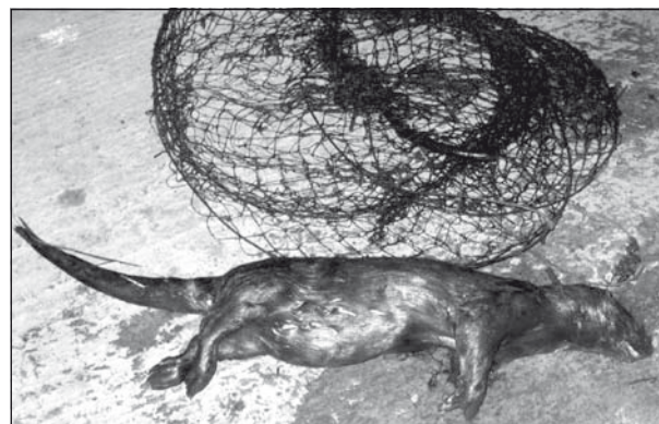
A varsába tévedt vidra teteme

hajlandó velük hadba szállni. Bizonyítja ezt a januárban elkobzott hálók és varsák mennyisége. A dolog szépséghibája csupán az, hogy sajnos nem mindig érkeznek kellő időben az ellenőrök és nem minden esetben sikerül élve megmenteni és szabadon engedni a csapdába