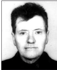
FUSZKÓ Károly (1925–1999)