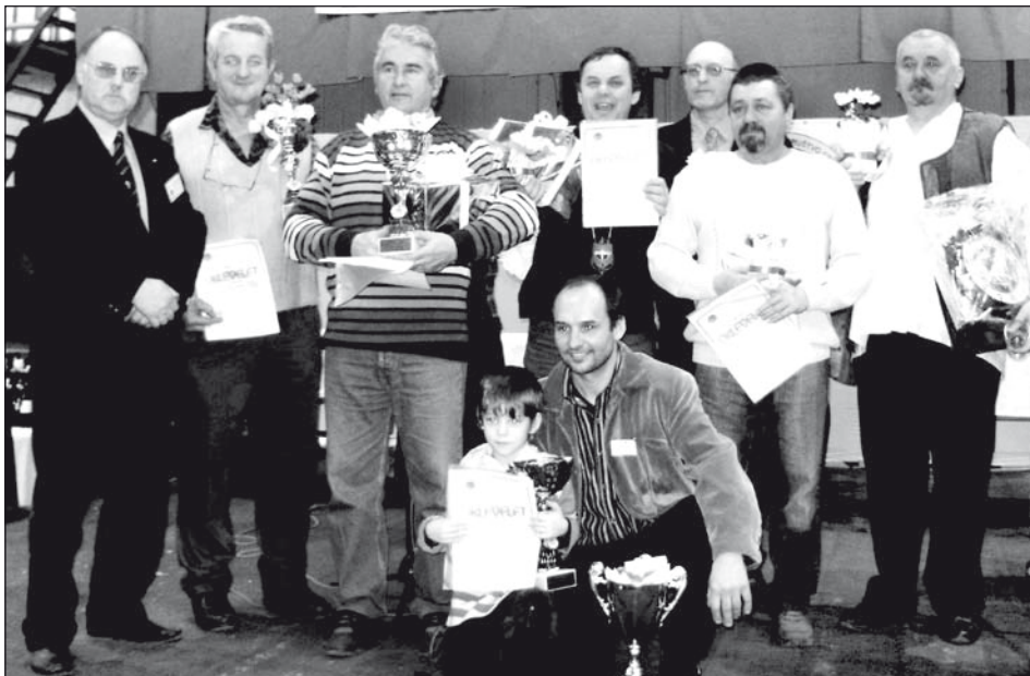
A XII. Vince-napi Borverseny győztesei

A XII. Vince-napi Borversenyen és Borkóstolón a helyi önkormányzat, a helyi közösségek képviselőin kívül számos rangos vajdasági, külföldi vendég is jelen volt. A rendezvény főszponzorai a Tartományi Gazdasági Titkárság és a temerini községi önkormányzat volt.