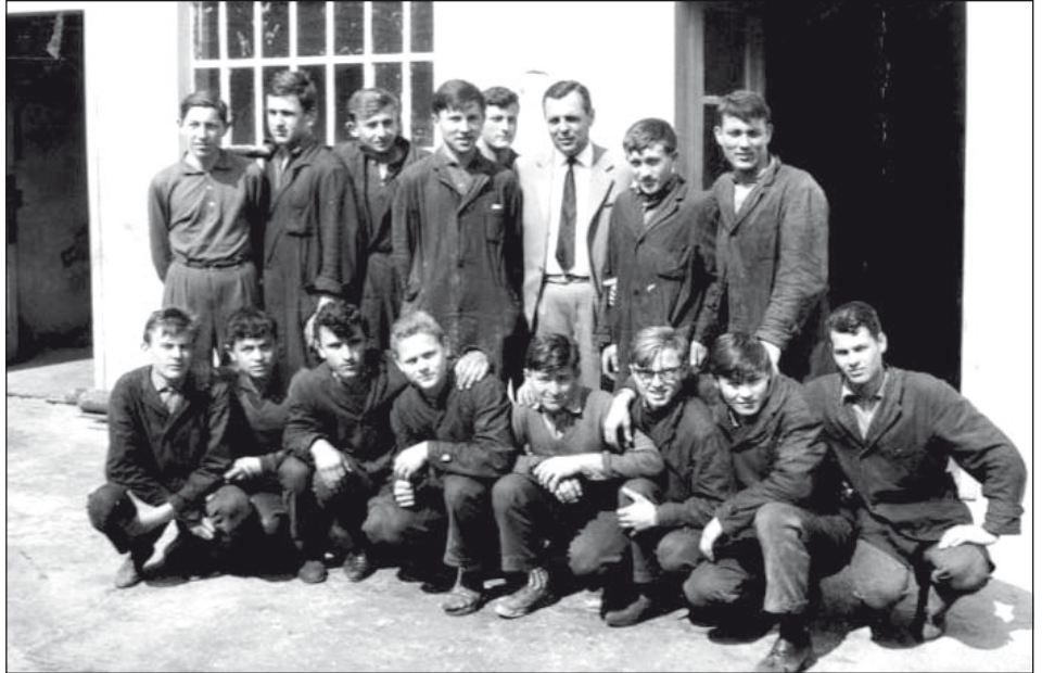
Az egykori Metalum ipari tanulói. A szerző az alsó sorban jobbról a második

Suttyo legényke, tizenhét éves lehettem, 1963-at írtunk. A suskavacos stiklim ebben az évben kora tavasszal történt, de már májusban be volt programozva a következő. A vasárnap szent nap volt, a haverokkal a találkozás el nem maradhatott. Mégis egy szombati napon az apám így szólt hozzám: