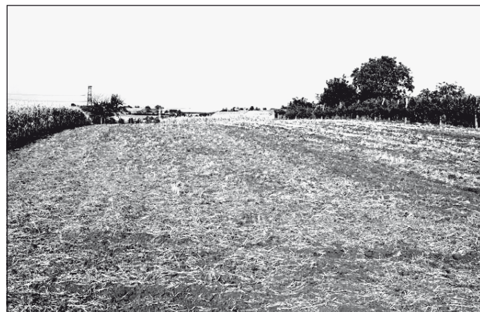
A helyi gazdák is bérelhetnek az állami földekből

A bérbe adható mintegy 1473 hektárnyi termőföldet különböző nagyságú területekre osztották, mégpedig úgy, hogy abból megművelésre a kisgazdáknak is jusson a megejtendő árverésen.