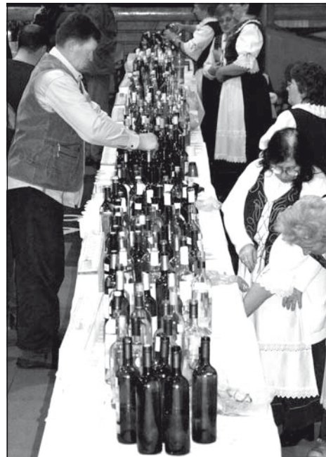
Még lehetett válogatni

– A XII. Vince-napi Borversenyre 533 minta érkezett, amit 12 szakbizottság bíralt el. Ezek tagjai nemzetközi és hazai eminens szakemberek, borbírák voltak, ide érte a szerbiai és a vajdasági borászatban elismert borházak tulajdonosait. Lényeges, hogy maguk a borászok is megtapasztalják, egy-egy bornak hogyan kell „kinéznie”. A 12 bizottságba öt országból érkeztek a szakemberek. A 2008-as esztendőben kitűnő borok termettek, erről az értékelt minták tanúskodnak. Egyértelmű, hogy az évjárat kitűnő nyersanyagot adott a gazdáknak, ide érte a cukorfokot és a savakat, ám a borászok számára is akadt teljesítendő feladat. Ha nem időzítették jól a szüretet, akkor savhiányos borokat kaptak. A nagy melegek hatására jellemző volt a savhiány, mivel a savak a szőlőben úgymond elégték. Akik azonban a kellő időben szüreteltek, nagyon szép, sőt gyönyörű borokat tudtak a palettán elhelyezni. A bíráló utáni kimutatásokban nagyon szép eredmények körvonalazódtak: 8 nagy arany, 82 arany, 158 ezüst és 184 bronzérem. Az eredményekből is látszik, hogy a 12 év alatt hogyan ívelt felfelé a borkészítés minősége. A borászok nagyon jól át tudják adni egymásnak szerzett tapasztalataikat – mondta a borverseny elnöke.