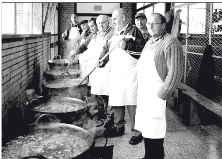
Öt üstben készült a finom disznópaprikás