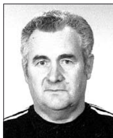
KISS Ferenc (1946–2008)