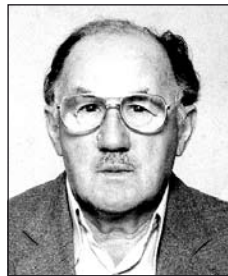
MAJOROS Józseftől (1925–2008)

„S az esztelen verseny végére érvén, megláttam a celszalagot.