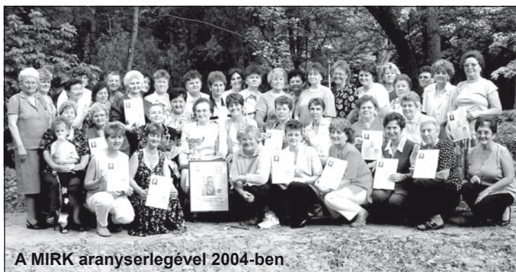
A MIRK aranyserlegével 2004-ben

veszünk részt a vallási ünnepeken. Általában szervezeten vonulunk be a templomba Gyümölcsoltó Boldogasszony napján, anyák napján és Gizella napján, valamint Szent Illés napján és Krisztus Király vasárnapján.