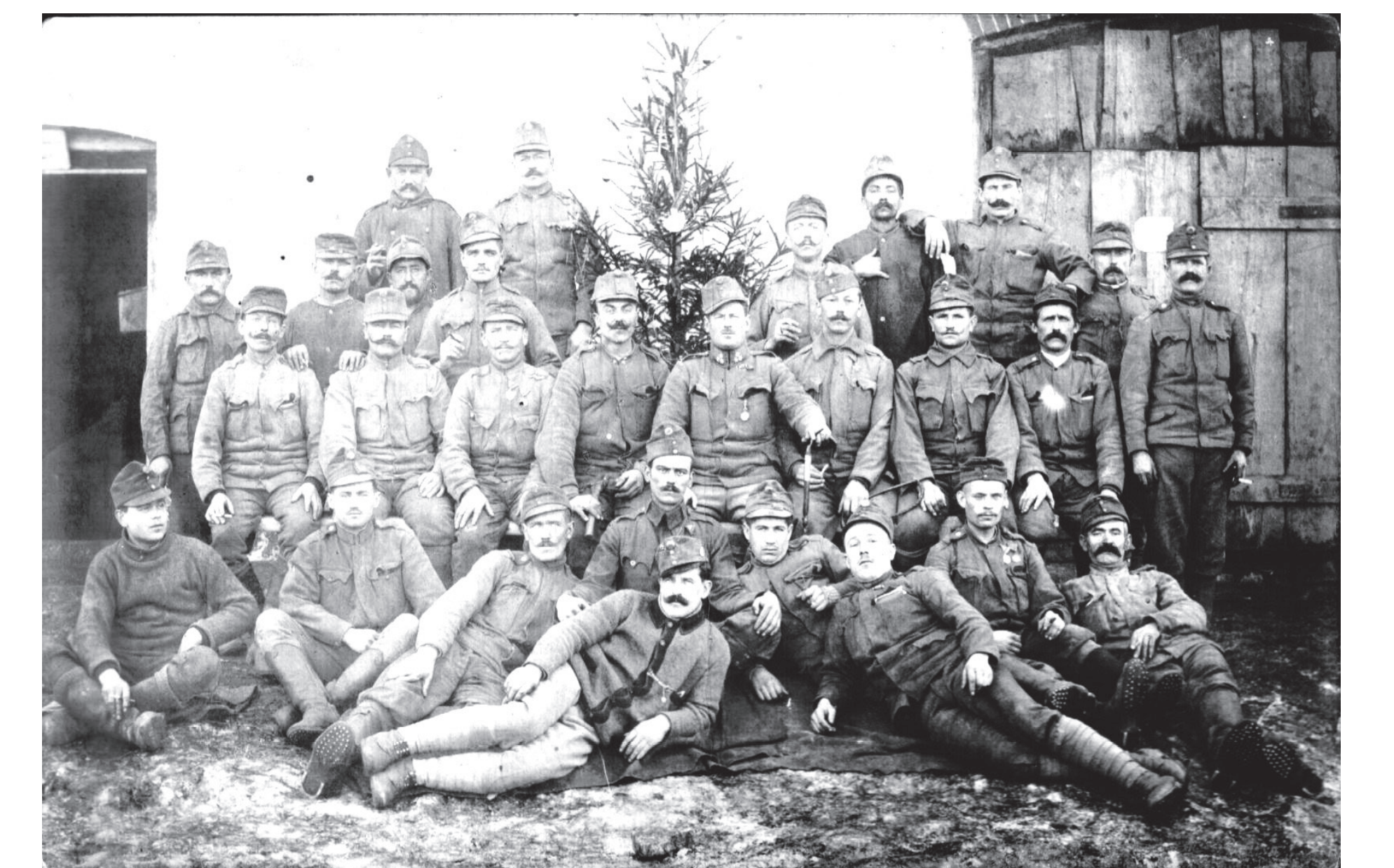
Karácsonyi csoportkép Olaszországban