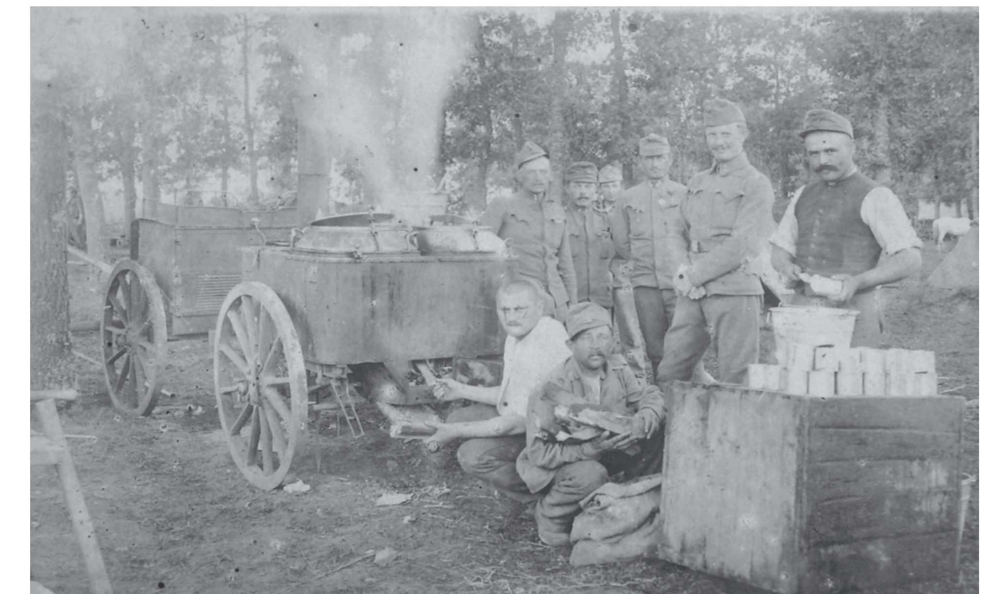
Készül a menázi a gulyáságyúban