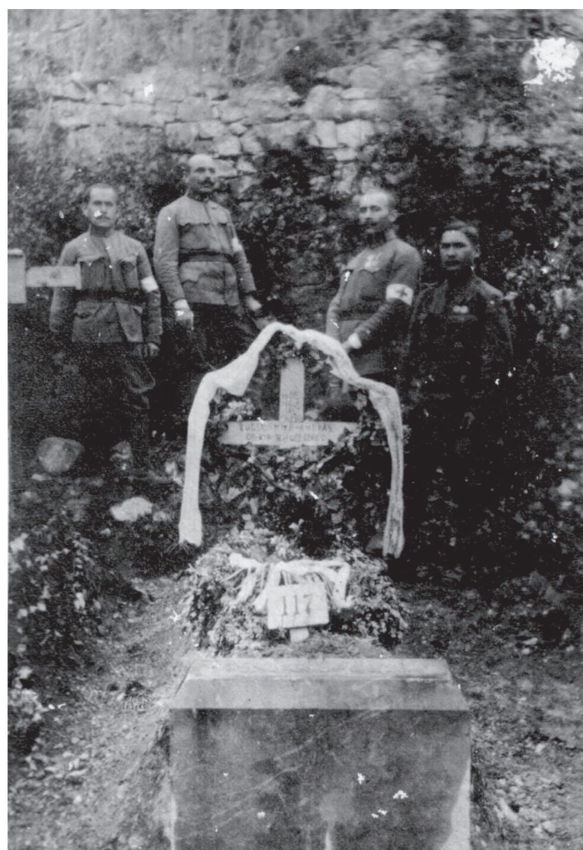
Egy elesett katona temetése a fronton