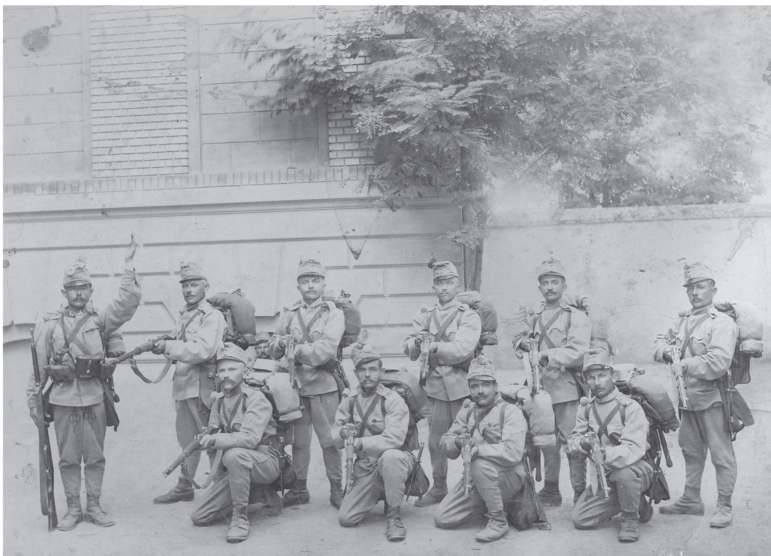
Harcra készen a szakasz