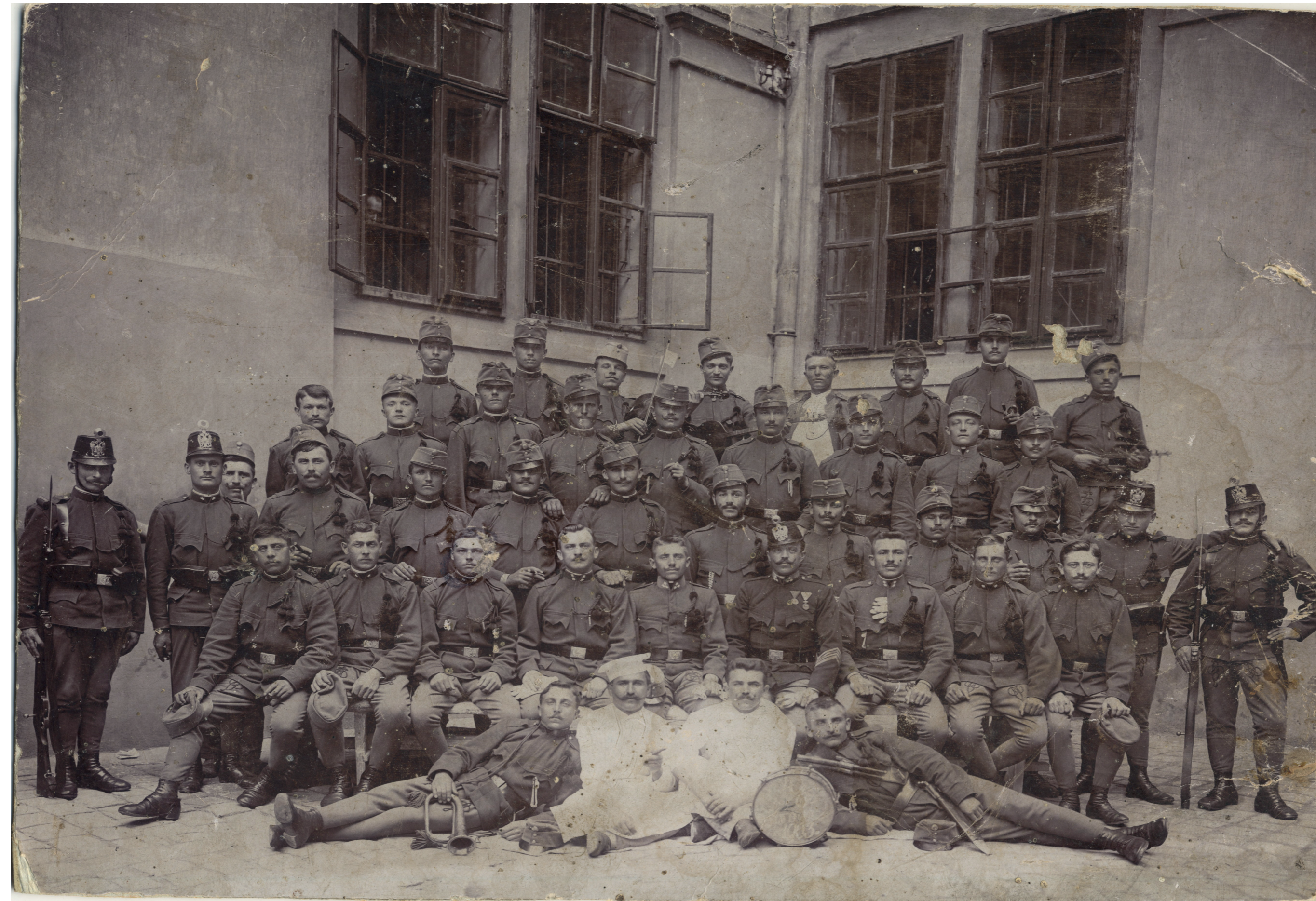
Utolsó közös kép a frontra indulás előtt