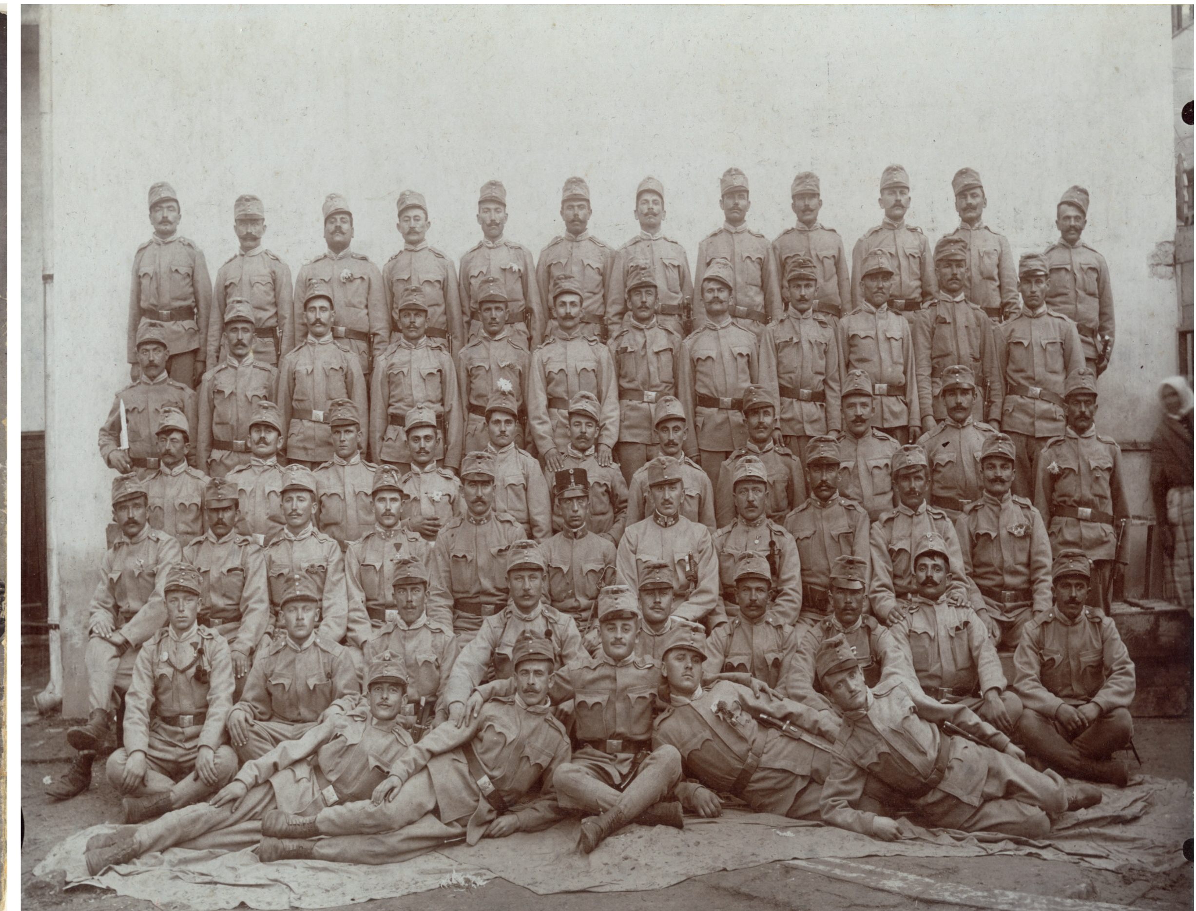
A szabadkai 6. honvéd gyalogezred egyik egysége